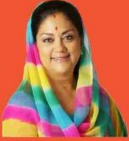
श्रीमती वसुन्धरा राजे मानवीय विकास, राजस्थान सरकार