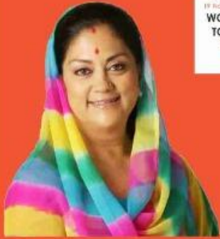
श्रीमती वसुन्धरा राजे मानवीय विकास, राजस्थान सरकार