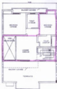
FIRST FLOOR PLAN ( DUPLEX )