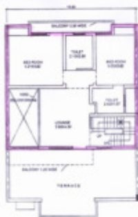
FIRST FLOOR PLAN ( DUPLEX )