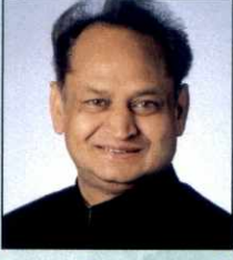
श्री अशोक गहलोत मुख्यमंत्री, राजस्थान