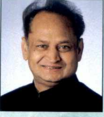
श्री अशोक गहलोत मुख्यमंत्री, राजस्थान