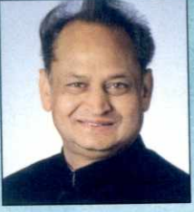
श्री अशोक गहलोत मुख्यमंत्री, राजस्थान