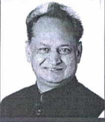
(श्री अशोक गहलोत) माननीय मुख्यमंत्री, राजस्थान