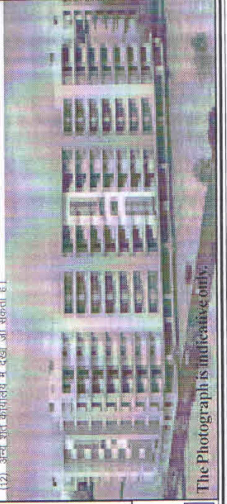
The Photograph is indicative only.